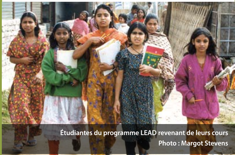
Étudiantes du programme LEAD revenant de leurs cours

Grâce aux Adolescent Resource Centres (ARC), des jeunes femmes ont accès à 15 mois de formation de base et à des cours d'apprentissage de l'autonomie fonctionnelle ainsi qu'à de la formation en matière d'emploi. L'avantage des exploitations agricoles familiales est évident. Avec l'aide de jeunes femmes confiantes et informées, les familles peuvent mieux gagner leur vie et demeurer dans leurs collectivités, jouir de moyens de subsistance sains et assurés et éviter le risque de se retrouver dans les taudis de Dhaka où plusieurs aboutiraient autrement.