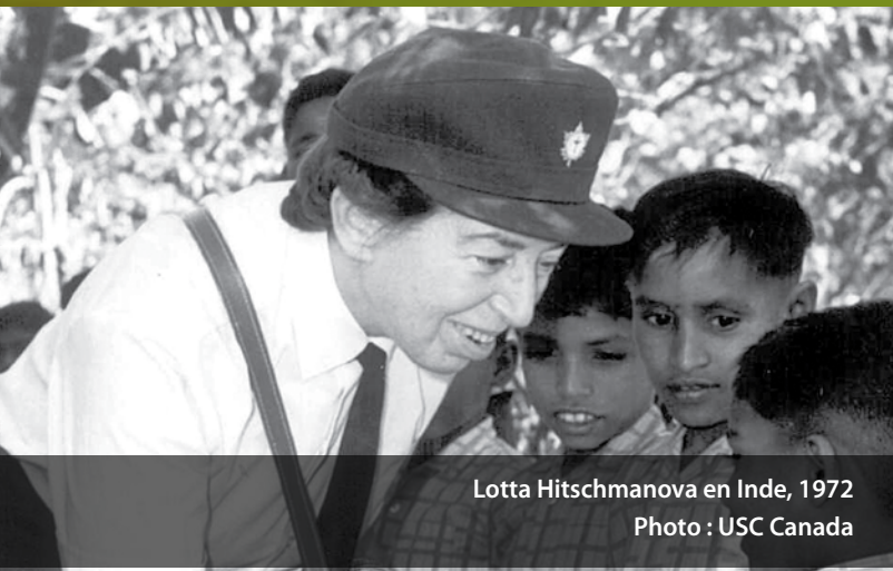
Lotta Hitschmanova en Inde, 1972

Nous partageons sa conviction que chacun a le droit de réaliser son plein potentiel et de planifier son avenir en utilisant ses propres ressources et sa créativité.